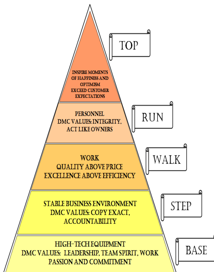
Figura nr. 2

Viziunea Driessen Manders Company contureaza aspiratiile firmei si detaliaza valorile si actiunile implementate pentru a urmari Harta indeaproape. Viziunea a fost dezvoltata sub forma unei piramide (figura nr. 2) cu cinci niveluri care simbolizeaza drumul firmei Driessen Manders Company catre top!